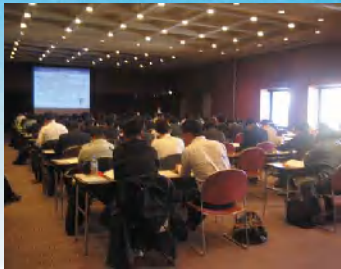
(総合)防犯設備士養成講習風景