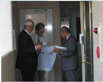
防犯優良マンション調査審査員