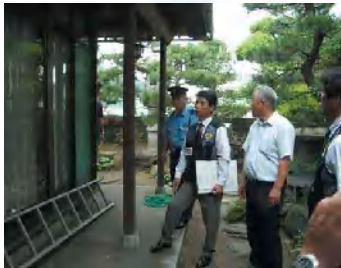
地元警察と密着した防犯活動