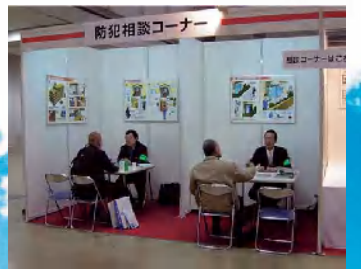
催し物会場等での防犯相談活動