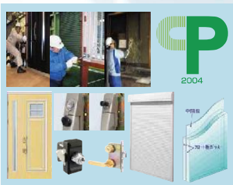
2004年 GPマーク(防犯建物部品)