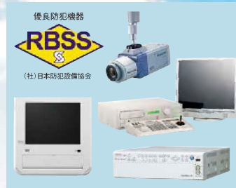
2008年 RBSSマーク(優良防犯機器)